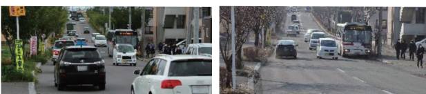
写真5 昭和団地通の空港道路開通前(左)と開通後(右)の様子

整備前は「産業道路」と呼ばれている主要道道函館上磯線の渋滞が激しく、それを迂回するために多くの車両が住宅街の市道へと流れ、事故なども頻発していました。そのため渋滞の緩和と地域住民の安全確保は急務でした(写真4、5)。