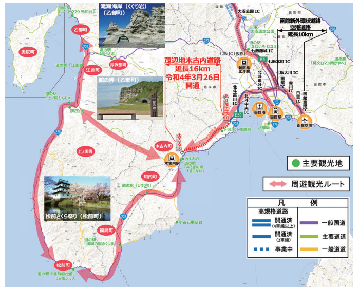
図3 道南地域の観光施設・交通拠点