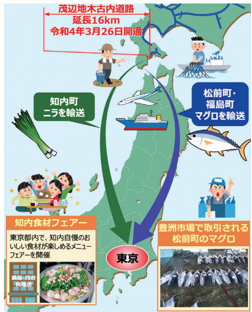
図4 農産品・水産品の輸送状況