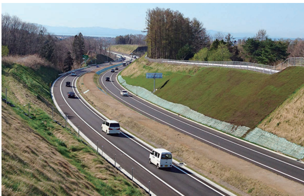
写真3 開通した函館新外環状道路の「空港道路」

マグロにとどまらず豊富な農産物や水産品があり、それらの輸送効率化も課題でした。また函館に限らず広域周遊観光の活性化や救急搬送の速達性・安全性向上などの効果も期待されていました。