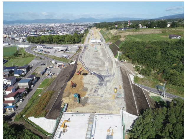
写真6 空港道路の工事

空港道路に関しては、市街地に近い環状道路ということもあり、工事をする上で近隣住民など関係者との調整に苦労しました。一時的な通行規制や騒音もあるなか、地域のみなさんのご理解とご協力をいただき、工事を円滑に進めることができました(写真6)。