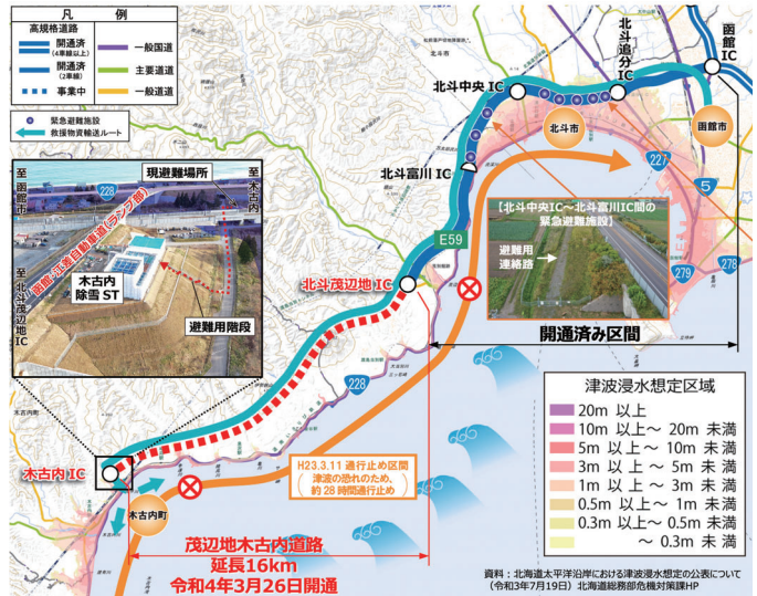
図6 緊急時の避難ルートと開通済み区間の緊急避難施設

空港道路と並行する道道函館上磯線(通称:産業道路)では、慢性的な交通混雑や、市道の交通量増加による、交通事故についても開通により、交通転換が図られ、混雑の減少や交通事故の低減、通学児童の安全性が向上しています。