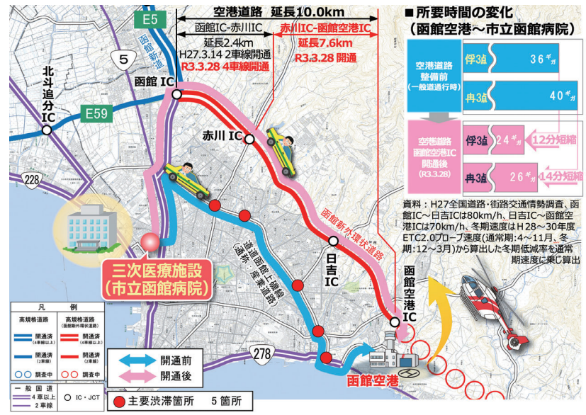
図5 三次医療施設への救急搬送ルート