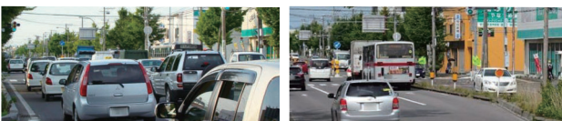
写真4 産業道路の空港道路開通前(左)と開通後(右)の様子

函館新外環状道路は、函館市内を東西に結ぶ高規格道路でこれまでに函館IC～赤川ICが暫定2車線で開通していました。昨年開通した空港道路は函館ICから函館空港ICの延長10km（函館IC～赤川IC間2.4km含）、構造規格は1種3級で4車線および暫定2車線となっており平成19年度に事業化、平成21年度に着手しています。