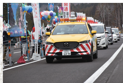
写真1 茂辺地木古内道路通り初めの様子