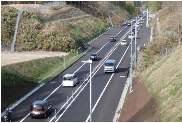
写真2 開通した函館・江差自動車道の「茂辺地木古内道路」