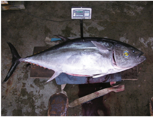
写真7 高速ネットワークを生かして、道南の新鮮な野菜や水産物を道外へ素早く輸送

地域のマグロは、約4割が函館港から東京に出荷されており、豊洲市場でも身焼けが少ないと高評価を得ています(写真7)。