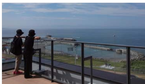
屋上展望デッキからの爽やかな眺め

また、施設から日本海を望むロケーションは多くの方々からご好評をいただいています。周辺にある恋人の聖地/厚田展望台からの眺めも最高です。旅の疲れを癒す一服の清涼剤として、是非お立ち寄りください。