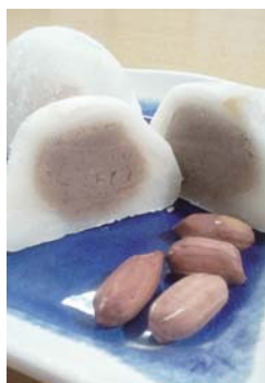
香ばしい落花生大福

1階の特産品販売コーナーは、地元石狩産にこだわった品物や石狩市の友好都市である石川県輪島市と沖縄県恩納村の特産品が並びます。