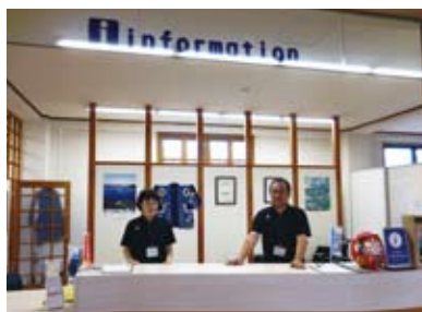
交流ゾーンの観光案内所

交流ゾーンには、外国語対応できる観光協会のスタッフが常駐し、お客様の要望に合わせて観光案内や周遊プラン、