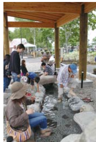
源泉掛け流しの足湯

道の駅「摩周温泉」は開発局が実施したアンケートで「ゆっくり休憩ができたと感じた『道の駅』」の1位となるなど、多くの来訪者にくつろぎの場所としてご利用いただいています。これは観光情報や特産品、イベントなどの充実とともに、清潔で心地よい環境整備に努力してきたことが成果に結びついていると感じます。特に好評なのは足湯や休憩コーナーの小上りで、ゆったりと長距離ドライブの疲れを癒すことができます。周辺には釧路川や水鳥を観察できる水郷公園があり、自然豊かなロケーションにも恵まれています。道東方面にドライブの際は、どこからも便利な道の駅「摩周温泉」にぜひお立ち寄りください。