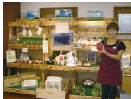
マンゴーなどの農産物販売コーナー