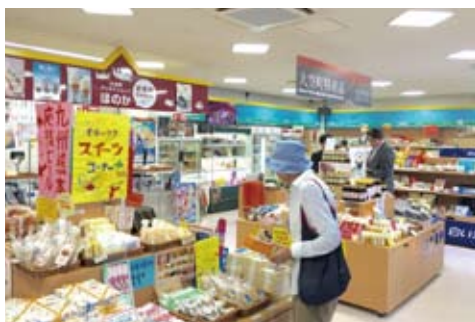
アンテナショップ 「ほのか」

「道の駅」があるメルヘンの丘は、地平線を見渡せる丘陵地が続き、美しい夕陽を望むポイントとして有名です。向かって左側の建物「メルヘン観光交流センター(通称：メルヘンびつ)」には観光協会の事務所や飲食テナントが入り、正面の建物には、アンテナショップ「ほのか」と「カルチャーセンター」が入っています。町の特産品のしじみや豚肉、チーズなどの商品を販売するほか、農・畜産物の加工室があり、特産品を使用した商品の製造・開発を実施。屋外には芝生や花壇が設置され、長距離運転の方にも便利な24時間利用できる休憩スペースも完備しています。