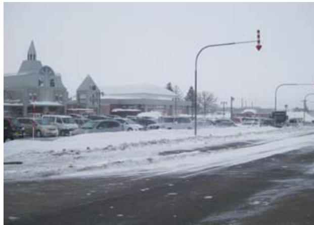
平成25年3月の暴風雪災害状況