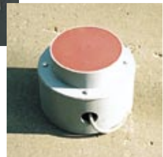
路面表示灯（平面式）