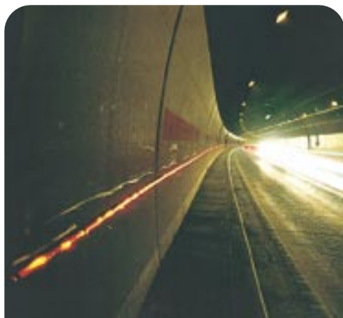
視線誘導灯（トンネル内設置状況）