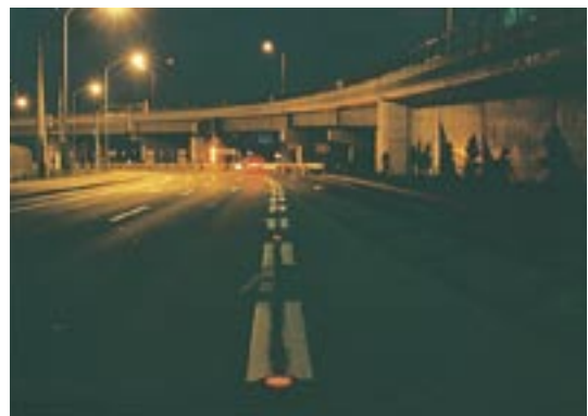
路面表示灯設置状況（平面式）

■ 問い合わせ／第一興業株式会社 TEL 011-664-8878 FAX 011-664-8288