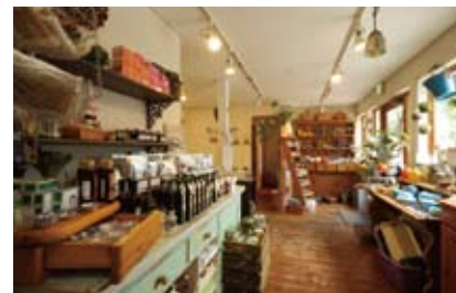
食器やキッチン用品などいろいろな雑貨も販売している