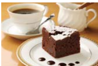
定番人気の「ガトーショコラ」