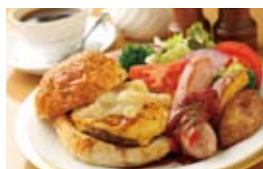
地元産の食材を生かしたおいしい食事が、スキーの後の空腹を満たしてくれる