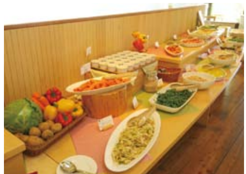
色とりどりの野菜を素材に合わせていろいろな調理法で提供