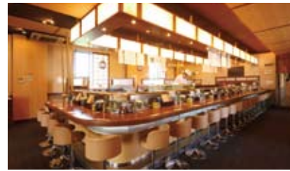
広いカウンターとボックス席のほか宴会用の小上がり席もある