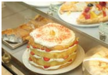
ショーケースにはデザインも楽しい季節のケーキが並び