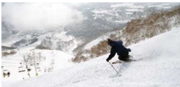
世界有数の雪質を誇るニセコはスキーヤーの憧れの場所

人気の大きな理由は、「パウダースノー」と称されるフワフワの雪質と豊富な雪量、オーストラリアからカナダや欧州に行くより近いアクセスの良さ、温泉や飲食店、ショッピングなどアフタースキーが充実していること等です。今では海外からの移住者も増え、ますます国際色豊かなエリアとなっています。