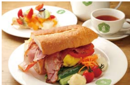
開店当初から愛される「グラウビュンデンサンド」はスクランブルエッグ、ベーコン、チーズ入り