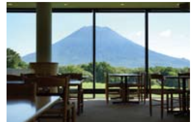
店内外から雄大な羊蹄山を一望できる

窓の外には羊蹄山がそびえ、夏は燃えるような緑と明るい花々、冬は雪景色が広がり、季節を通して目を楽しませてくれます。店内は劇場のように段差のある設計で、どの席からも景色が見渡せるのもうれしい心配りです。