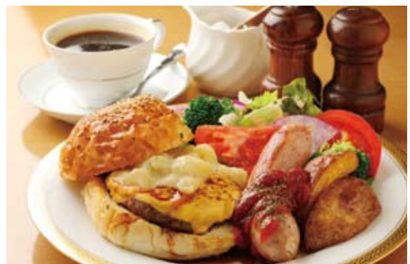
「白老牛100%ハンバーグ ジャンボソーセージプレート」はつけ合わせのニセコ産じゃがいもも美味