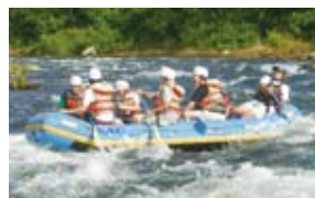
日本有数の清流「尻別川」を下るラフティングは夏のニセコで一番人気を誇るアクティビティ

ニセコの観光の特徴は、1月と8月にピークを持つ「二峰型」といわれます。冬はスキー、スノーボード、スノーモービルなどのウィンタースポーツ、夏は登山やトレッキング、沼めぐりなどの自然探索、ラフティングやダッキー、カヌー、サップ(スタンドアップパドル・サーフィン)といったウォータースポーツ、サイクリング、乗馬、ゴルフなど様々なアクティビティを存分に楽しむことができます。そのため、