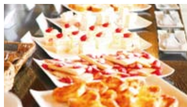
オリジナルスイーツや軽食が並ぶ「期間限定ケーキバイキング」