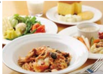
ランチは野菜ビュッフェに、肉料理、魚料理、パスタ(2種)から1品を選ぶスタイル