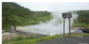
温泉のまち蘭越町の「大湯沼」。隣接する日帰り入浴施設「雪秩父」がこの秋リニューアルオープンしたばかり