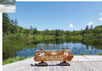
神秘的な美しさを見せる神仙沼