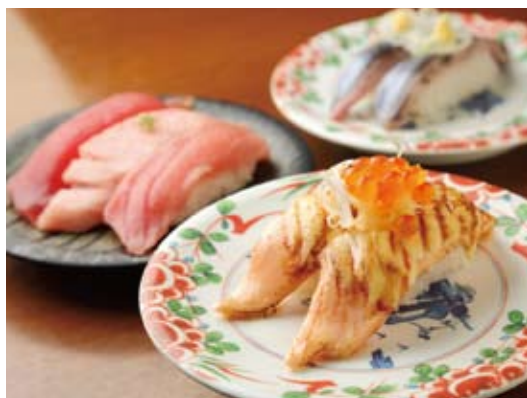
人気の「炙りサーモン」(手前)、平日限定サービスの「まぐろ三昧」(左)、旬のサンマ(右奥)